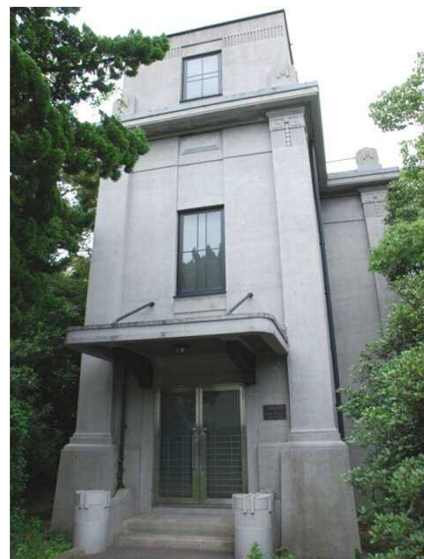
九大病院唯一の医学博物館”久保記念館”