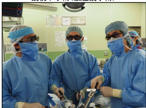
鏡視下手術(腹腔鏡手術)