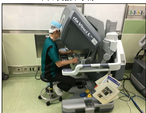
ロボット支援下手術